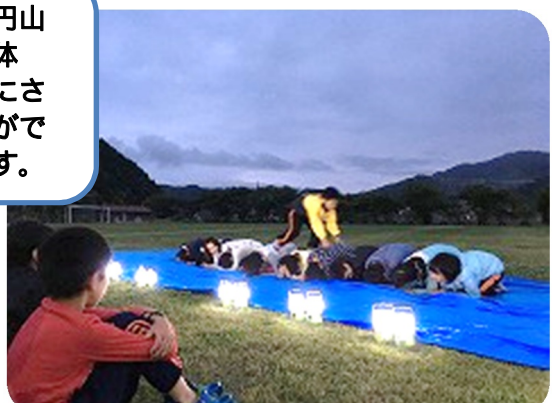
4日目（港東小学校特設ステージ） 夕べの集いでスタンツを発表しました。仲間と創りあげた最高の思い出！