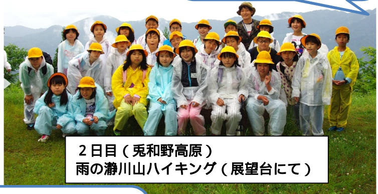
2日目（兔野高原） 雨の瀨川山ハイキング（展望台にて）